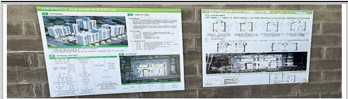
그림8:장미사택 부지에 세워지는 공공임대주택 계획안

과거 사택 마을과 산업 시설들은 시대의 흐름에 따라 변화되었다. 삼척 탄광촌의 양지사택은 리모델링을 거쳐 게스트하우스, 탄광 테마 갤러리, 카페테리아 등으로 탈바꿈하며 과거 삼척시 탄광산업의 현장을 체험하는 문화 공간이 되었다.