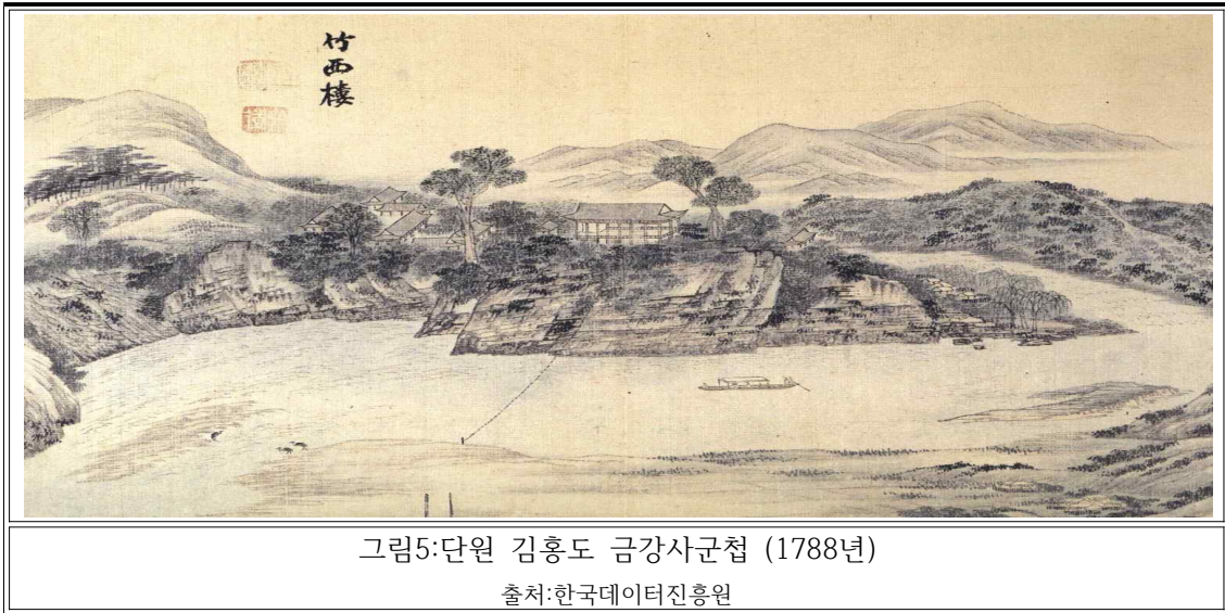
그림5:단원 김홍도 금강사군첩 (1788년)