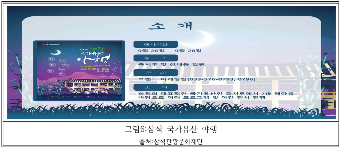
그림6:삼척 국가유산 야행

죽서루가 만들어낸 삼척시의 축제인 삼척 국가유산야행은 삼척시의 자부심인 국보 죽서루의 가치를 축제를 통해 알리고 기억하자는 취지로 만들어져 죽서루가 만들어낸 삼척시의 문화가 되었다.