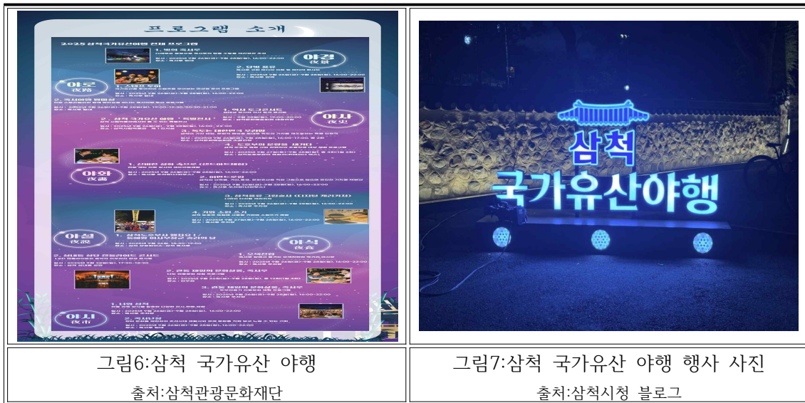
그림6:삼척 국가유산 야행

이 축제는 삼척의 상징인 죽서루에서 열리는 삼척시의 대표적인 축제이다. 축제를 통해 삼척시와 주민들은 죽서루가 가진 역사적·문화적 가치를 현대적으로 재해석하여, 지역민과 삼척을 찾은 관광객들에게 널리 알리고 있다.