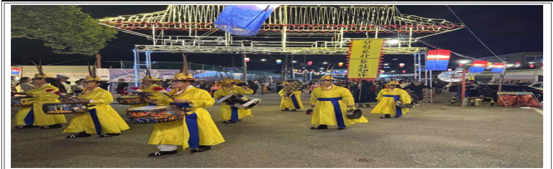
그림8:삼척도호부사 부임행차 행사 사진