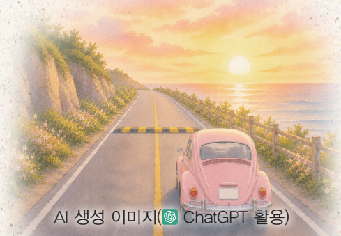
AI 생성 이미지 (ChatGPT 활용)

어머니를 모시고 병원 가는 길, 십 미터 앞 방지턱이 달리는 나를 향해 황급히 손사래를 친다. 브레이크를 지그시 밟고 호흡을 고른다. 마음이 느긋해진다. 기분 좋게 언덕을 넘는다.