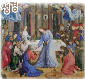
‘성체를 받아 모시는 제자들’, 후스투스 판 겐트 작

“나는 하늘에서 내려온 살아있는 빵이다. 누구든지 이 빵을 먹으면 영원히 살 것이다”(요한 6,51).