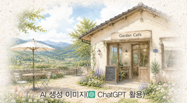
AI 생성 이미지 (ChatGPT 활용)

유월, 강렬한 에너지로 푸르름이 더해지는 싱싱한 여름입니다. 자신을 자신보다 더 잘 알고 계시는 하느님의 선한 이끄심을 믿고, 포기했던 희망 하나 끄집어내어 용기 내봐도 괜찮을 것 같은 계절입니다. 행운을 빕니다.