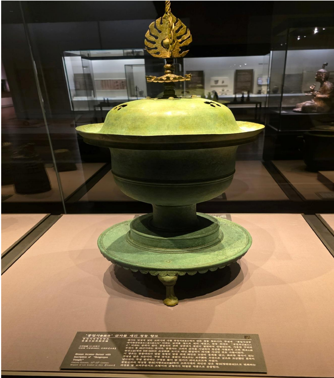
“봉업사총불상” 글자를 새긴 청동 향로 봉업사경 불향로 청동(국립중앙박물관) 경기도 안성에 있던 고려시대 사찰 봉업사(奉業寺)에서 만든 청동 향로이다. 향로에 “봉업사경불상대사(奉業寺敬佛大舍)” 이라는 글자를 정으로 새겨 새겼고, 받침 위에는 “봉업사(奉業寺)가 후세가 후 200년이라는 뜻이다. 봉업사는 고려의 건국을 기념하여 창건한 사찰로서, 고려 태조가 왕건(王建)이 임종(臨終)의 초상(肖像)을 모시고 계신 불상에서 계시를 깨닫던 장소 사용이었다. 이 향로는 봉업사가 말한 원형의 양식(樣式)을 모시고 계신 불상에서 계시를 깨닫던 장소 사용이었다. 수평을 받은 모습이다. 수평 장식은 불꽃이 떠오르는 보주(寶珠) 모양으로 금으로 도금했던 조각이 남아있다. 수평 위에는 수평을 틀어 양 조각이 고려(高麗)로 유래했다. 봉업사의 약칭(略稱) [가랑(加浪)]에서 고려시대의 하인간(下人) 간은 향로(香爐)로 변형하는 과정을 잘 보여주면서도 조형미와 균형미가 탁월한 작품으로 손꼽힌다. Bronze Incense Burner with Inscription of “Bongyeop-sa Temple” Goryeo Dynasty, 14 th -15 th Century Height of One Kubit is 20.1 [Inches]

고려를 대표하는 문화로는 불교를 빼놓을 수 없다. 전시된 청동 향로는 '봉업사'라는 글자가 새겨진 유물로, 불교 의례에서 향을 피울 때 사용한 것으로 보인다. 향로의 형태가 크고 안정적이며, 위쪽 장식이 인상적이었다.