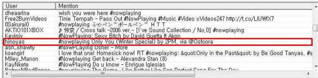
그림 2 수집된 트위터의 음악 관련 글

화면이다. 이어서 수집된 글 중 그룹 2PM 의 Only You 라는 곡에 대한 정보를 수집하고 수집된 정보를 이용해 사용자 질의에 대한 결과를 사용자에게 제공하는 과정을 보여준다.