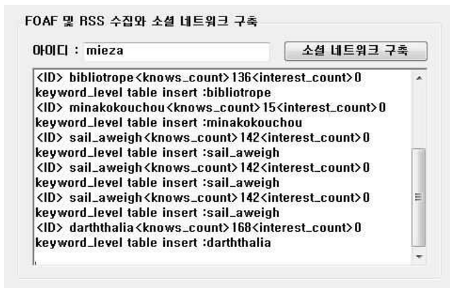
(그림 3) FOAF 및 RSS 수집과 소셜 네트워크 구축 인터페이스

제안한 시스템의 개발환경은 마이크로소프트 비주얼 스튜디오 2008 과 마이크로소프트 SQL 서버를 이용하였으며 개발언어는 C#를 이용하였다.