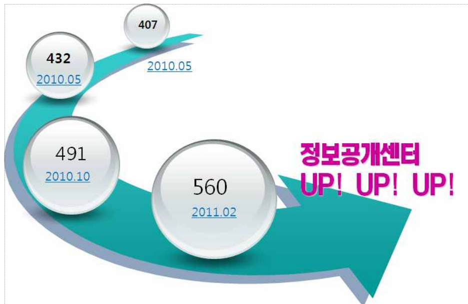
<정보공개센터 회원 증가세>