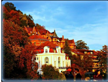
Schwabenhaus in Tübingen