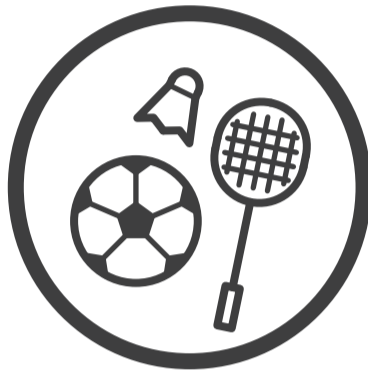
여가 및 취미활동