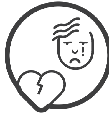
연애 및 친구관계