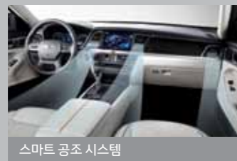
스마트 공조 시스템