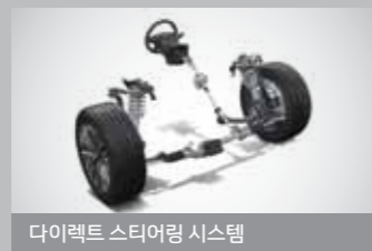
다이렉트 스티어링 시스템