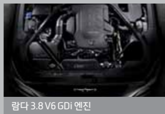
람다 3.8 V6 GDI 엔진