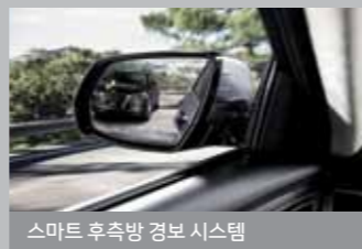
스마트 후측방 경보 시스템