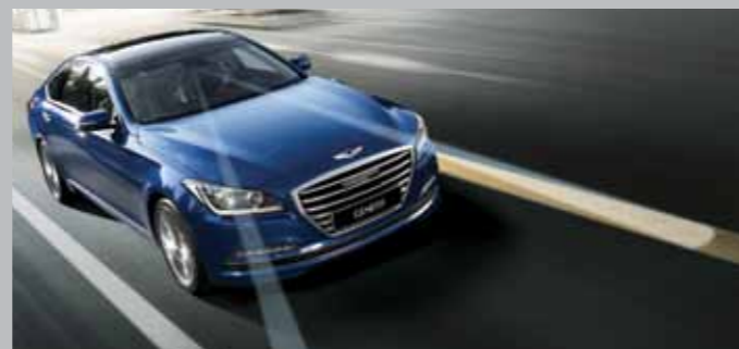
차선이탈 경보 시스템