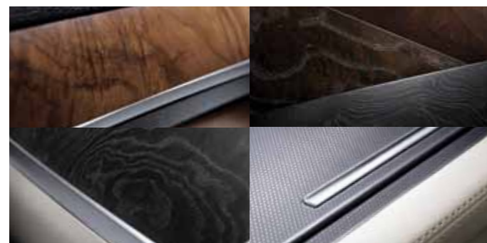
오픈포어 리얼우드, 리얼 알루미늄