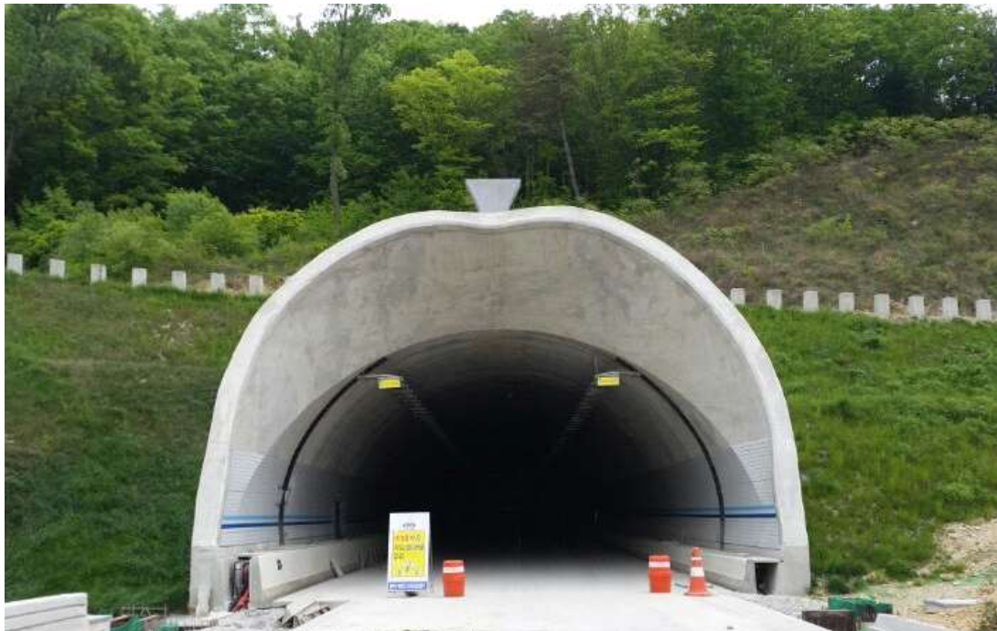
삼탄2터널(사과모양 터널 입구)