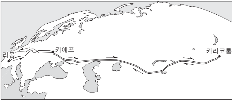
▲ 카르피니의 여행 경로

교황 인노켄티우스 4세는 이 제국의 유럽 침입을 저지하고 크리스토퍼 콜럼버스를 선교할 목적으로 프란체스코회 수도사 카르피니를 사절로 파견하였다. 카르피니는 리옹을 출발하여 카라코룸 부근에 도착하였다. 그곳에서 이 제국의 새로운 대칸의 즉위식에 참석하였다. 그 후 교황의 복종을 요구하는 대칸의 편지를 들고 돌아왔다.