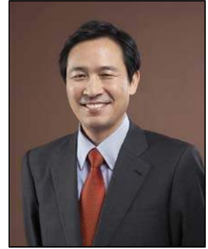
더불어민주당 원내대표 우 상 호