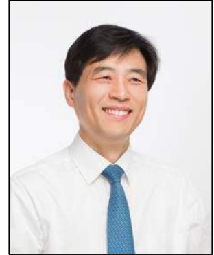
국회의원 김민기 (경기 용인시을)

유난히 길게 느껴졌던 겨울을 보내고 다시 맞는 봄입니다. 침체된 출판 산업 곳곳에도 따뜻한 온기가 전해지길 기원합니다. 국회 교육문화체육관광위원회 김민기 의원입니다. 반갑습니다.