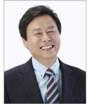
국회의원 도종환 (충북 청주시흥덕구)