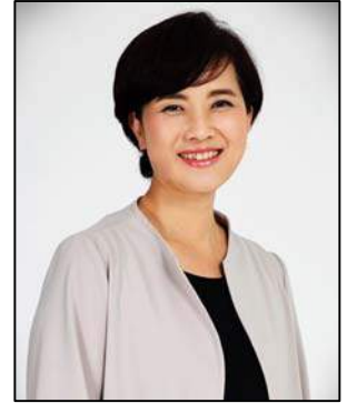
국회의원 유은혜 (경기 고양시병)