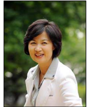
더불어민주당 대표 추미애