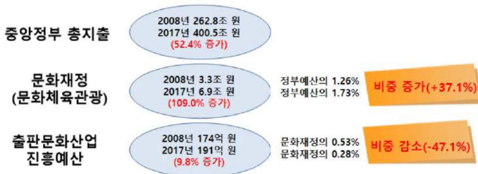
〈그림 3〉 지난 10년간 정부 예산 추이 (2008년 → 2017년)

한국출판문화산업진흥원(이하 '진흥원')이 2016년에 집행한 예산은 363억 원이었다. 출판 및 독서 진흥 예산을 합한 총액이다. 이 가운데 독서진흥 사업인 세종도서(우수도서) 구입·배포 예산이 142억 원으로 가장 많고, 진흥원 운영 및 각종 사업 지원 예산이 100억 원, 독서 문화 증진 사업이 약 29억 원, 전자출판 육성 25억 원, 국제교류사업 지원 약 22억 원, 파주 출판도시 활성화 지원사업 10억 원 등이다. 총예산도 부족하지만, 블랙리스트 시비에 오른 세종도서 구입비나 각종 행사 예산을 제외하면 실질적으로 출판산업 인프라 구성에 쓸 예산은 거의 없다. 2017년 출판진흥 예산은 진흥원 지원비(104억 원)를 포함하여 191억 원에 불과하고, 중앙정부 총예산 및 문화재정에 비추어 제자리걸음에 머물렀다. 특히 지난 10년 사이 전체 문화재정은 3.3조 원에서 6.9조 원으로 109% 증가한 반면 출판진흥 예산은 증가율이 9.8%에 불과했고, 문화재정에서 출판진흥 예산이 차지하는 비중은 10년 전의 0.53%에서 올해 0.28%로 반감되었다. 이에 비해 상업성과 자생력, 글로벌 경쟁력까지 갖춘 게임산업 육성 예산은 2016년 458억에서 2017년 642억 원으로 40.2% 늘어났다. 국가 정책이 출판문화산업 진흥을 얼마나 무시하고 홀대하는지 단적으로 보여준다. 문화산업의 기간 산업인 출판의 중요성에 기반하여 새로운 정책환경 변화에 조용한 정책혁신(policy innovation)으로 출판정책의 패러다임 변화를 꾀하지 않고 정책유지(policy maintenance) 또는 정책승계(policy succession)로 큰 변화 없이 기존 정책을 연장하는 데 급급한 것이 가장 큰 원인이다.