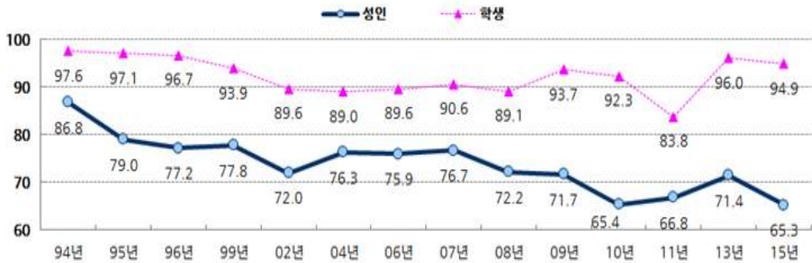
〈그림 1〉 국민 독서율 추이(1994~2015)

자료 : 문화체육관광부 · 한국출판연구소, 국민 독서실태 조사(1994~2015년)