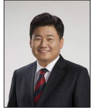
국회의원 소 병 훈 (경기 광주시갑)