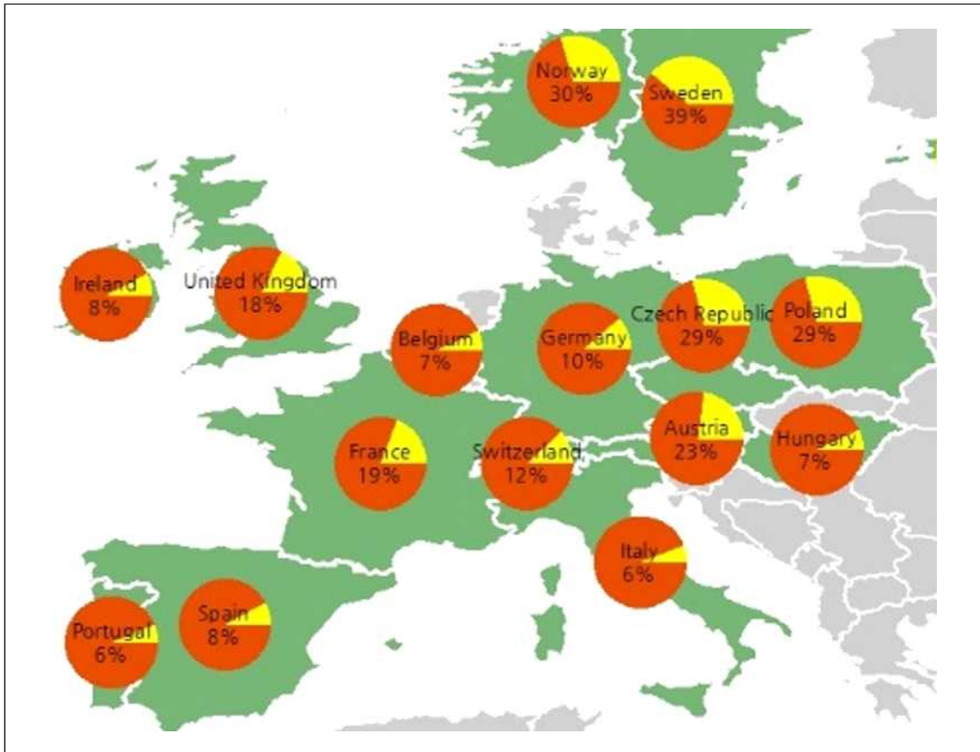
그림 6. 유럽국가의 사회주택 비중(2012년 기준)