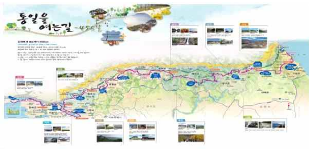
<통일을 여는 길>