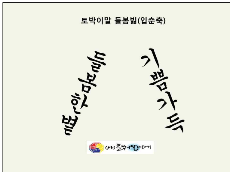
▶ 페이스북, '사)토박이말바라기'에 담긴, '[쉬운 말 쓰기]들봄뽕(입춘축)' 글 보러 가기 https://www.facebook.com/groups/430351457002380/permalink/2021470744557102