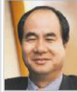
윤석금 (웅진그룹 회장)

우리는 분명히 역사적 전환기에 서 있다. 이 때 방향을 제대로 잡아야 한다. 오늘날의 혼돈의 대부분은 바로 그 방향성의 부족에서 온 것이다. 세계경영연구원은 바로 그 방향성을 제공해 주고 있다.