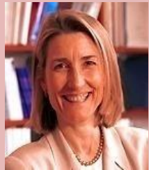
Amy Edmondson (학술고문 하버드 경영대학교수)