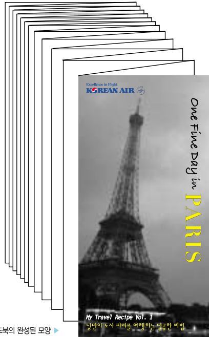
파리 시티 가이드북의 완성된 모양 ▶