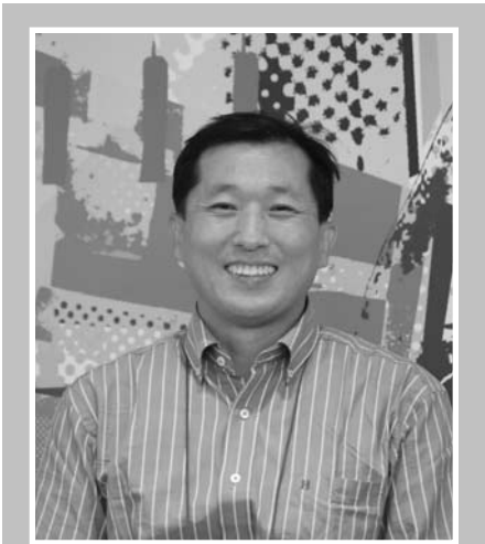
코스타에 만난 사람