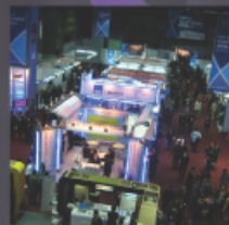
VoIP/PTV TELEPHONY WORLD 2005