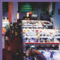
IPTV WORLD EXPO VoIP 2008