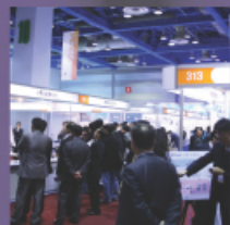
IPTV WORLD EXPO VoIP 2008 Oct. 15 - 17, 2008