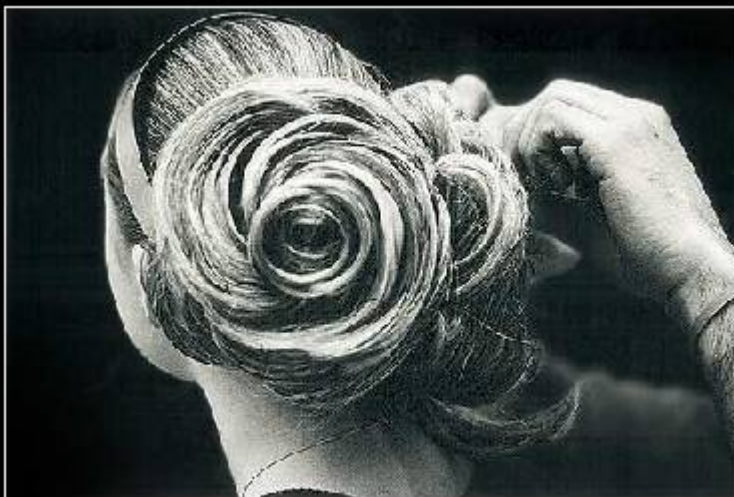
Camellia hairstyle, 2000 Spring/Summer Haute Couture collection Photograph by Capella