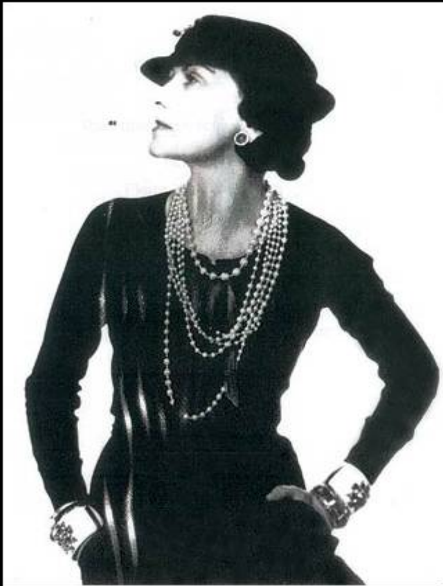
Mademoiselle Chanel, 1935 Photograph by Man Ray