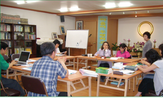
▲ Ŭonbularaj esperantistoj okazigas lingvan kurson. 2008년 6월 동안양 교당에서 1박 2일 합숙