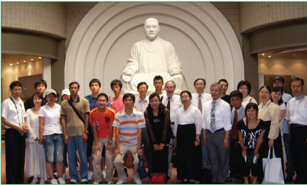
▲ Internacia Medito-Kurso okazinta en Esperanto en 2007 2007년 에스페란토 이루어진 국제선방