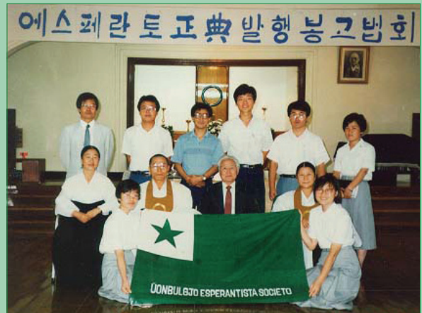
▼ Post la eldonfesto de La Fundamenta Instruo en 1988 1988년 에스페란토 정전 발행 봉그법회