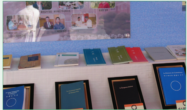
▲ Tradukitaj sanktaj libroj el Esperanto en aliajn lingvojn 에스페란토판에서 번역된 여러 나라말 교서들