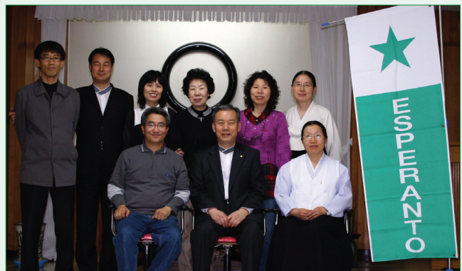
▲ Ŭonbularaj esperantistoj kunvenas ĉiujauĉe. 매주 목요일 모임을 갖는다.