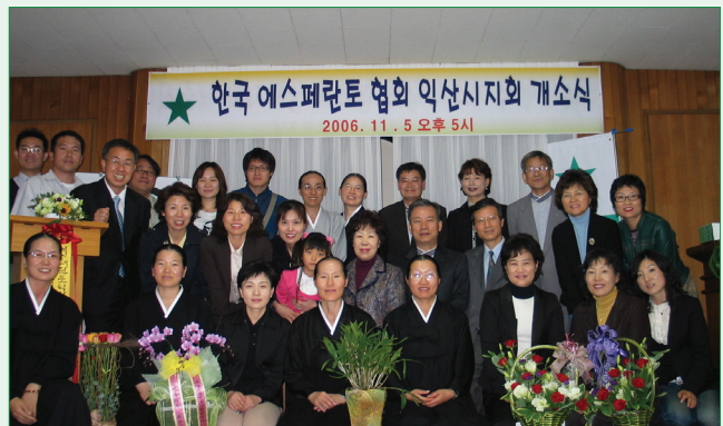
◀◀ La sidejo de EAŬ estis inaŭgurita en 2006. 2006년 11월 5일 역전보화당내 사무실 개소