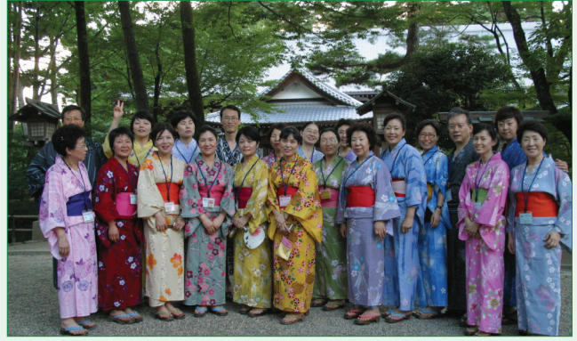
▲ Ŭonbularaj esperantistoj vizitis la Oomoto-Centron en 2007. 2007년 일본 오오모토 방문